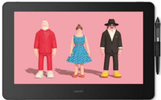
Wacom Cintiq Pro 16 Künstler: Superfiction

Wer einen kreativen Schub hat, möchte seine Vision mühelos umsetzen können. Deshalb haben wir das Wacom Cintiq Pro 16 weiter verbessert und dafür gesorgt, dass du damit noch bequemer und natürlicher arbeiten kannst. Dank der fortschrittlichen Ergonomie und einem intuitiven Gefühl beim Arbeiten mit dem Stift auf dem Bildschirm kannst du dich ganz auf deine Kunst konzentrieren.